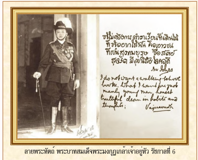
ลายพระหัตถ์ พระบาทสมเด็จพระมงกุฎเกล้าเจ้าอยู่หัว รัชกาลที่ 6

หลวง หรือ โรงเรียนวชิราวุธวิทยาลัย ในปัจจุบันเมื่อวันที่ 2 กันยายน 2454 ใช้ชื่อว่า “กองลูกเสือกรุงเทพฯ ที่ 1” โดยพระองค์พระราชทานคำขวัญไว้ให้เช่นเดียวกับเสือป่าว่า “เสียชีพอย่าเสียสัตย์” ซึ่งยังคงใช้มาจนถึงปัจจุบัน และถือเป็นวันกำเนิดลูกเสือแห่งชาติจนทุกวันนี้