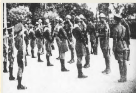
จากลูกเสือ เป็นยุวชนทหาร

ต่อมาในปี พ.ศ.2481 กระทรวงกลาโหมได้ยกฐานะแผนกที่ 6 ขึ้นเป็น “กรมยุวชนทหาร” จากนั้นในปี พ.ศ.2486 ได้มีการประสานโครงการยุวชนทหารกับลูกเสือเข้าด้วยกัน โดยการออกพระราชบัญญัติยุวชนทหารแห่งชาติ พ.ศ.2486 กำหนดให้มีองค์การยุวชนแห่งชาติขึ้น เมื่อวันที่ 8 ตุลาคม พ.ศ.2486 โดยกำหนดให้มีฐานะเป็นทบวงการเมืองอยู่ในบังคับบัญชาของ นายกรัฐมนตรี (จอมพล ป.พิบูลสงคราม) ในตำแหน่ง “ผู้บัญชาการยุวชนแห่งชาติ” และให้รัฐมนตรีว่าการกระทรวงกลาโหม เป็นรองผู้บัญชาการฝ่ายยุวชนทหาร และให้รัฐมนตรีว่าการกระทรวงศึกษาธิการ เป็นรองผู้บัญชาการฝ่ายลูกเสือ