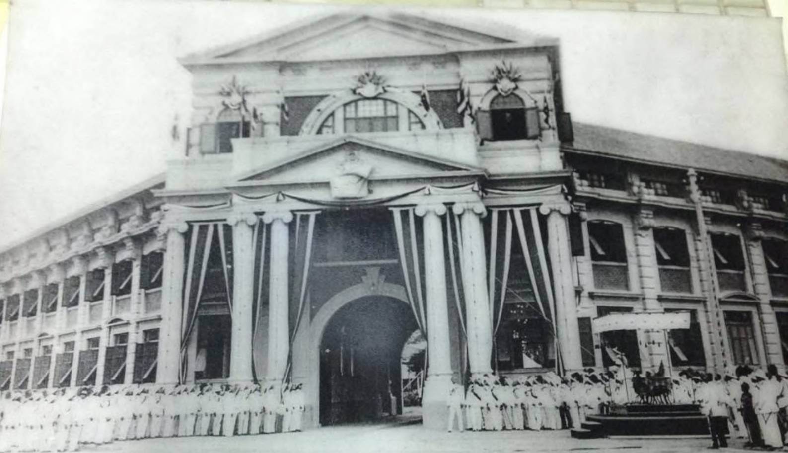
พระบาทสมเด็จพระมงกุฎเกล้าเจ้าอยู่หัว ทรงเปิดอาคารรั้วลลภ อาคารราชวัลลภ วันอังคารที่ ๑๕ เมษายน ๒๔๖๗