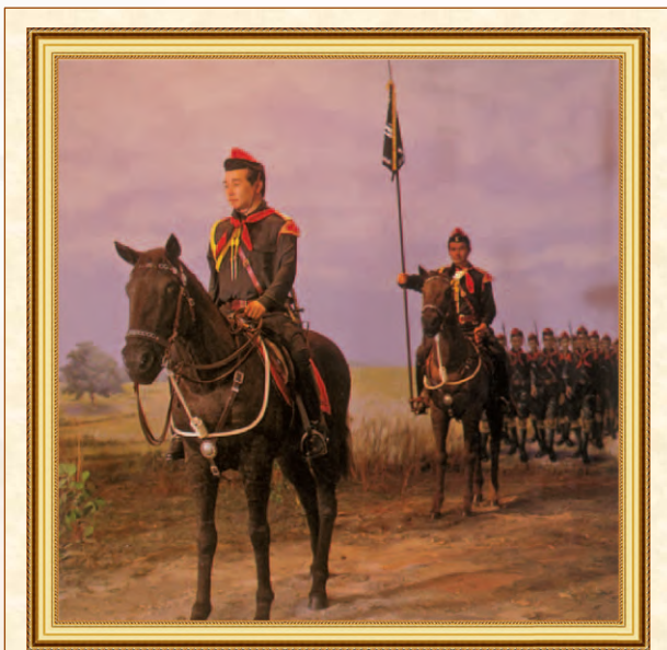
พระบรมรูปพระบาทสมเด็จพระมงกุฎเกล้าเจ้าอยู่หัว ทรงขึ้นตั้ง ทรงเครื่องปกตินายกองใหญ่ ผู้บังคับการกรมเสือป่าราชหลวงรักษาพระองค์ ทรงม้าพระที่นั่งนำเสือป่าและลูกเสือเดินทางไกลไปบวงสรวงพระเจดีย์ยุทธหัตถี ที่ตำบลดอนเจดีย์ จังหวัดสุพรรณบุรี เมื่อเดือน มกราคม พ.ศ.2456

เสือป่าในยุคนั้นมีด้วยกัน 11 กองพล แบ่งพื้นที่ตามจังหวัดต่าง ๆ ในแต่ละจังหวัดมีสโมสรเป็นของตนเอง โดยสโมสรของเสือป่านี้ใช้สำหรับการสังคมของเสือป่าและการฝึกสอนด้วย สโมสรแห่งแรกเปิดขึ้นที่ สนามเสือป่าเขาดินวนา กรุงเทพฯ เมื่อ 22 กรกฎาคม พ.ศ.2454 ทุกบ่ายวันเสาร์เป็นเวลาของเสือป่าหัตวีชาทหาร ซึ่งพระบาทสมเด็จพระมงกุฎเกล้าเจ้าอยู่หัวทรงหัดและสอนด้วยพระองค์เอง เมื่อจบการฝึกในแต่ละครั้งพระองค์ทรง อบรมเหล่าเสือป่าโดยอาศัยหลักพุทธศาสนา ประกอบ หลังจากอบรมแล้วเจ้าหน้าที่จะรวบรวมจัดพิมพ์เป็นแบบฝึกสอนเสือป่าและแจกจ่ายต่อไป โดยเฉพาะบทพระราชนิพนธ์ที่เราในยุคนี้รู้จักกันในชื่อ “เทศนาเสือป่า” ที่คำสอนของพระองค์ยังคงใช้ได้ดีมาจนถึงทุกวันนี้จะเห็นได้ว่าวัตถุประสงค์ในการตั้งกองเสือป่าและกองลูกเสือนั้น ก็เพื่อผลิตบุคลากรทั้งที่เป็นเด็กและผู้ใหญ่ที่มีความรู้ความสามารถในวิชาทหาร มีร่างกายและจิตใจที่พร้อมจะร่วมต่อสู้เพื่อช่วยกัน “รักษาดินแดน” รักษาอธิปไตยของชาติ