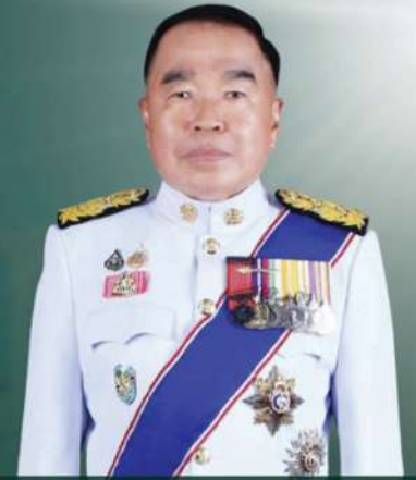
พลเอก นัฐพล นาคพาณิชย์ รัฐมนตรีว่าการกระทรวงกลาโหม